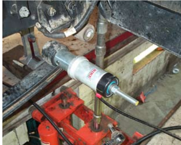
Extracción del viejo rodamiento en un camión DAF CF85 en Ford & Slater, Lincoln