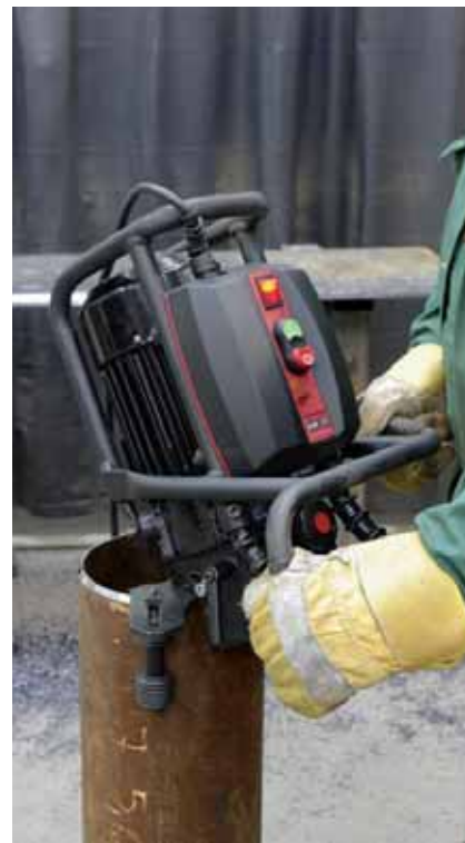
Biselado de tuberías