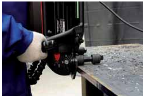
Refrentado de chapa