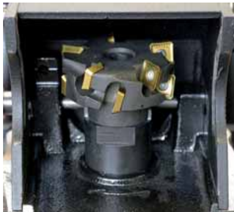
Cabezal de corte mono bloque con 10 plaquitas intercambiables fijadas con tornillos