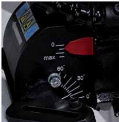
Ajuste del ángulo continuo de 0 a 60 grados