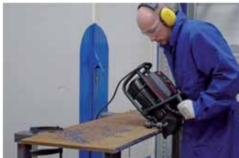
Biselado de chapa